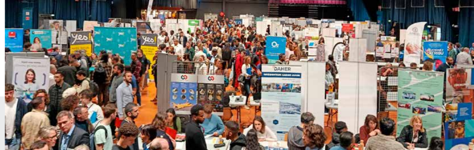
Franc succès pour notre Job Dating 2026.