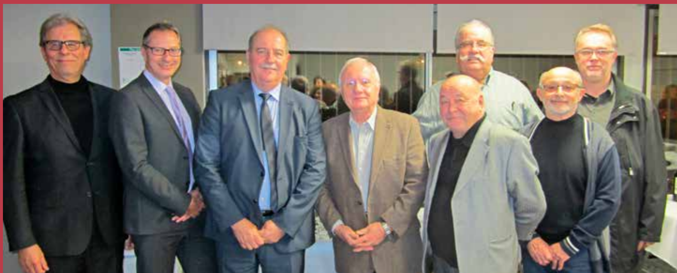
Une partie des membres fondateurs

L'histoire du Club d'Entreprises de l'Ouest Toulousain (CEO) débute en 1995, sous le nom de Club des Entreprises de Colomiers (CEC). Il est né de la volonté conjointe de la Ville de Colomiers et d'une poignée de dirigeants columérins, désireux de briser l'isolement inhérent à leur fonction.