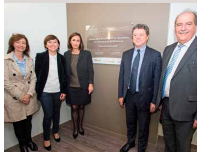
Inauguration des locaux du CEO

L'installation en 2016 dans des locaux dédiés, la MECA (Maison de l'Economie, du Commerce et de l'Artisanat), a été un tournant important. Ce passage d'un mode « nomade » à un ancrage fixe a permis de stabiliser les activités, d'accueillir réunions et ateliers et de renforcer le sentiment d'appartenance.